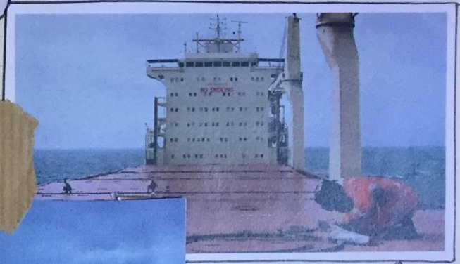
immense cargo sur lequel ils voyagent