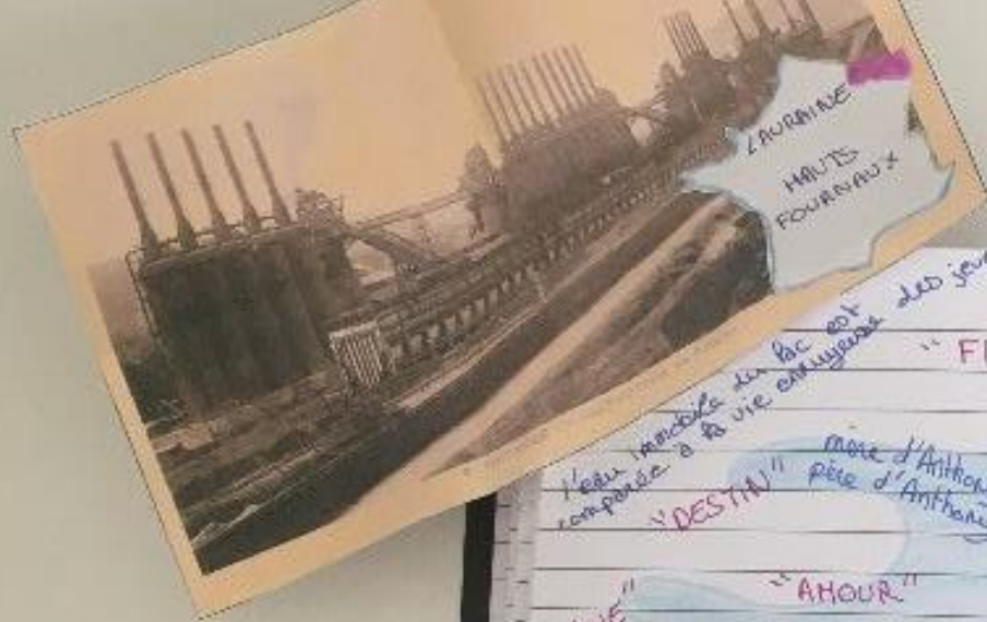
Leurs enfants après eux, Nicolas Mathieu